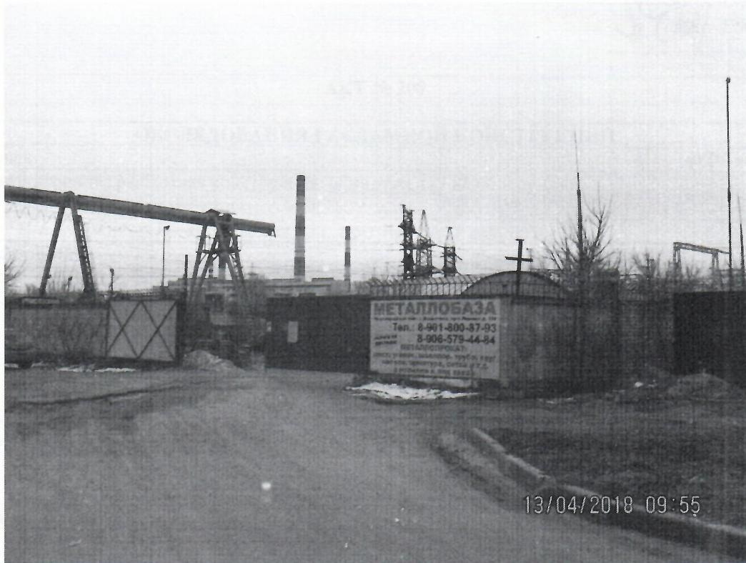
Схема установки рекламной конструкции с эскизным изображением «Металлобаза» расположенной по адресу: г. Дзержинск, Нижегородская обл., пр-т Ленина , в районе д.122

Фотофиксация рекламной конструкции с эскизным изображением «Металлобаза» расположенной по адресу: г. Дзержинск, Нижегородская обл., пр-т Ленина , в районе д.122