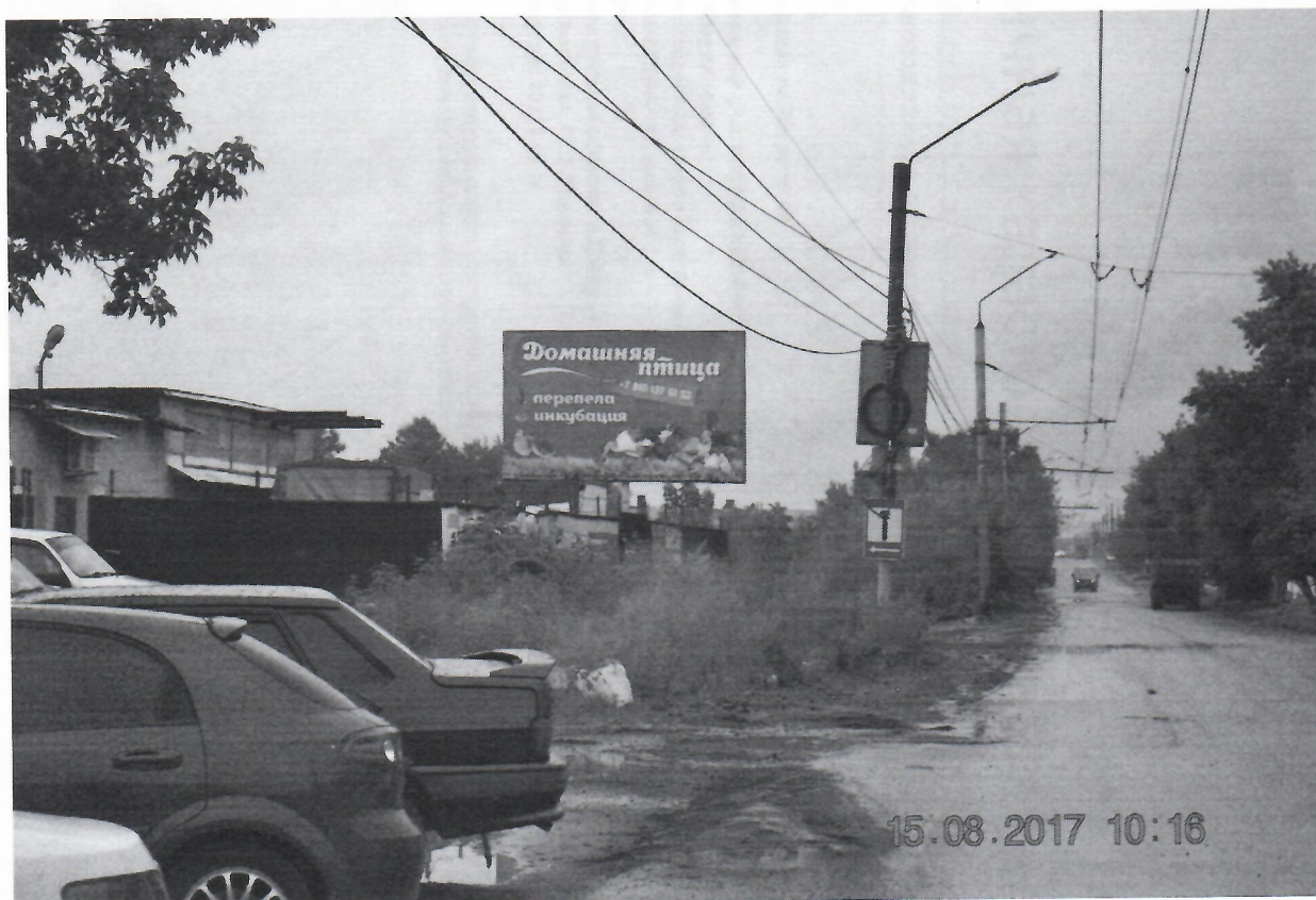
Фото 2. Вид по направлению движения по пр. Дзержинского в сторону ул. Чапаева.

Фото 1. Вид по направлению движения по пр. Дзержинского в сторону Заревской объездной дороги.