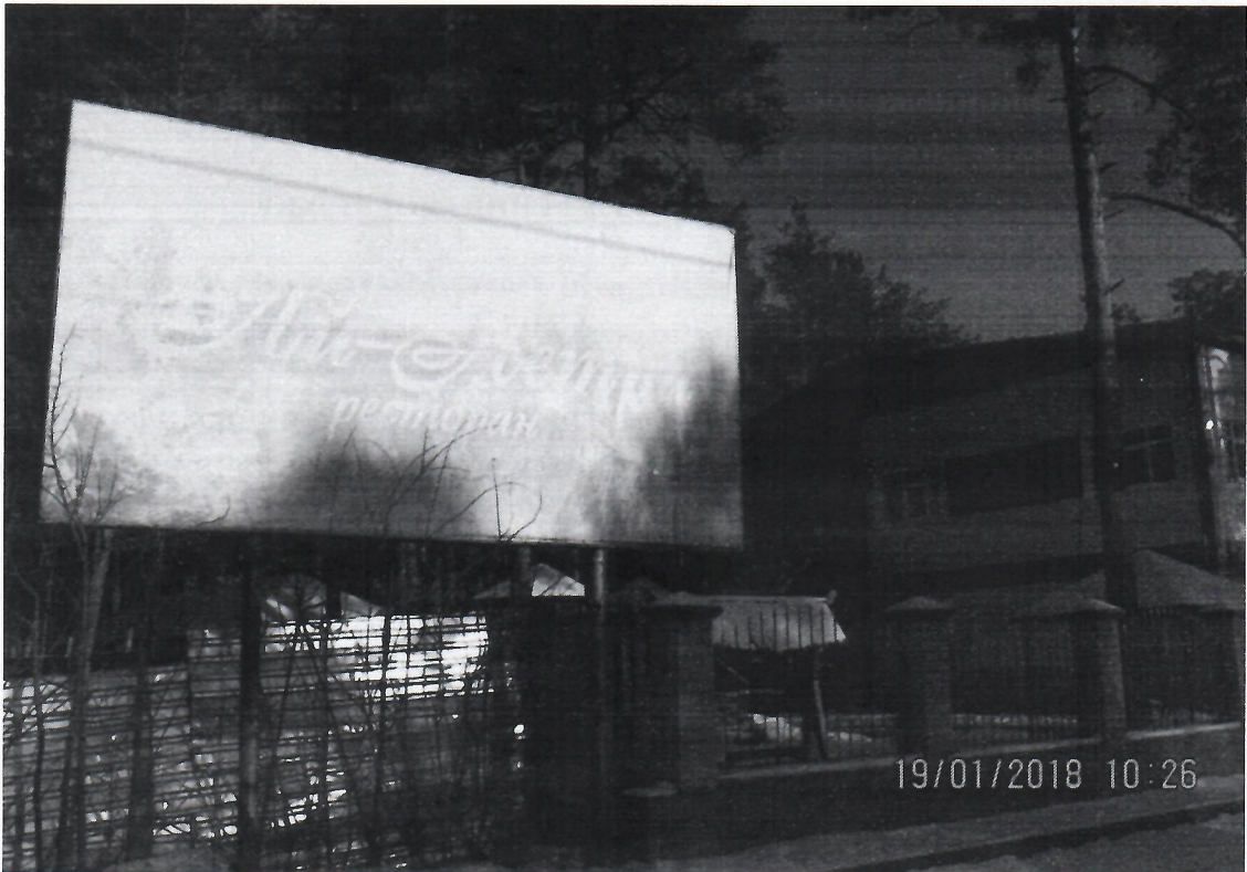
Схема установки рекламной конструкции расположенной по адресу: г. Дзержинск, Нижегородская обл., ул. Терешковой, в районе д.84

Фотофиксация рекламной конструкции расположенной по адресу: г. Дзержинск, Нижегородская обл., ул. Терешковой, в районе д.84