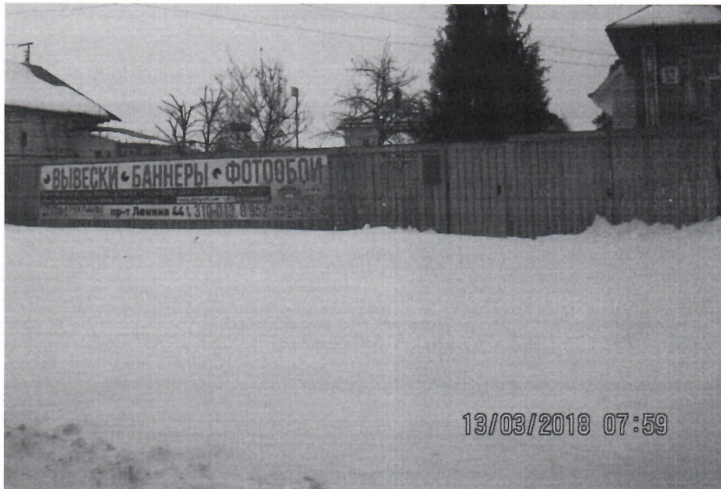
Схема установки рекламной конструкции расположенной по адресу: г. Дзержинск, Нижегородская обл., посёлок Пушкино, ул.Садовая , д.12

Фотофиксация рекламной конструкции расположенной по адресу: г. Дзержинск, Нижегородская обл., посёлок Пушкино, ул.Садовая , д.12