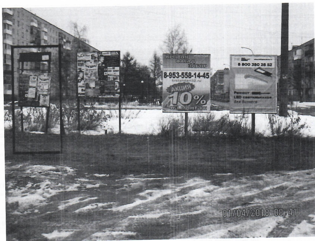
Схема установки рекламной конструкции расположенной по адресу: г. Дзержинск, Нижегородская обл., ул. Пушкинская, в районе д.12/7

Фотофиксация рекламной конструкции расположенной по адресу: г. Дзержинск, Нижегородская обл., ул. Пушкинская, в районе д.12/7