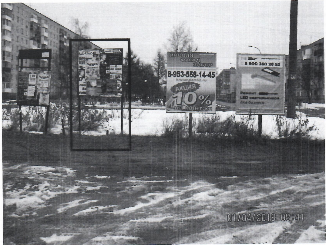
Схема установки рекламной конструкции расположенной по адресу: г. Дзержинск, Нижегородская обл., ул. Пушкинская, в районе д.12/7

Фотофиксация рекламной конструкции расположенной по адресу: г. Дзержинск, Нижегородская обл., ул. Пушкинская, в районе д.12/7