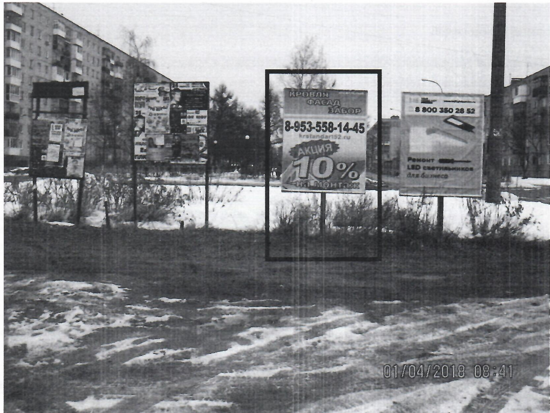
Схема установки рекламной конструкции расположенной по адресу: г. Дзержинск, Нижегородская обл., ул. Пушкинская, в районе д.12/7

Фотофиксация рекламной конструкции расположенной по адресу: г. Дзержинск, Нижегородская обл., ул. Пушкинская, в районе д.12/7