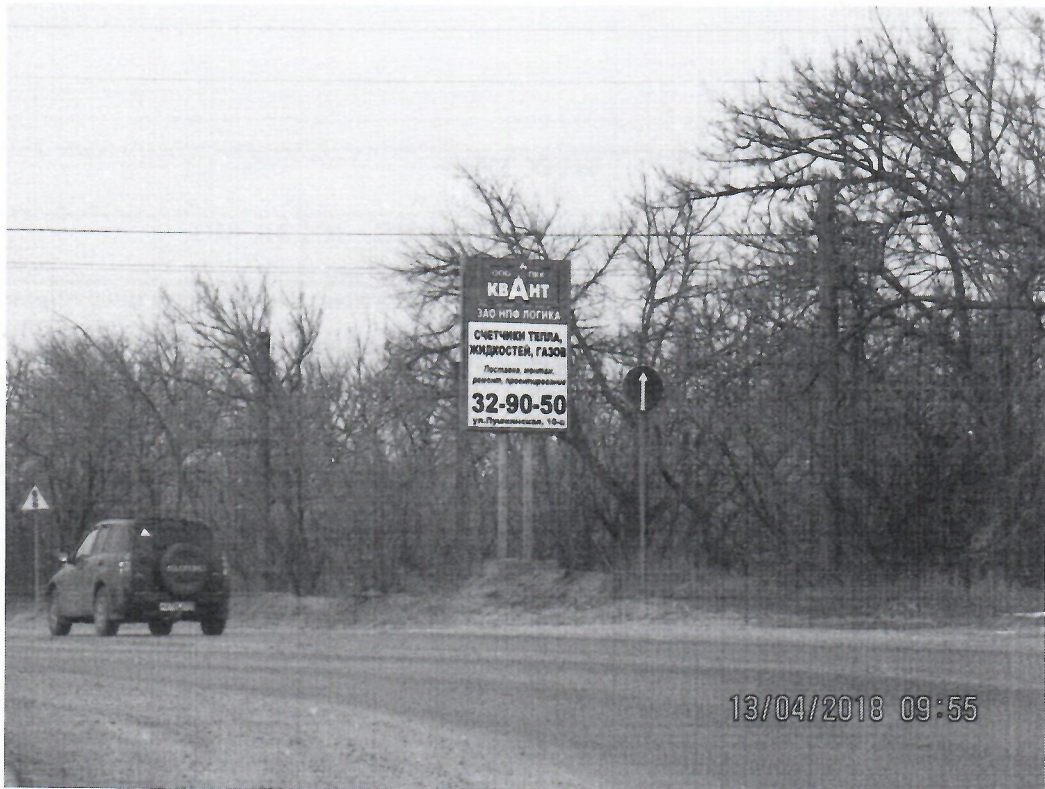
Схема установки рекламной конструкции 2x4 м. расположенной по адресу: г. Дзержинск, Нижегородская обл., в районе 150 м. Автозаводского шоссе, здание 2

Фотофиксация рекламной конструкции 2x4 м. расположенной по адресу: г. Дзержинск, Нижегородская обл., в районе 150 м. Автозаводского шоссе, здание 2