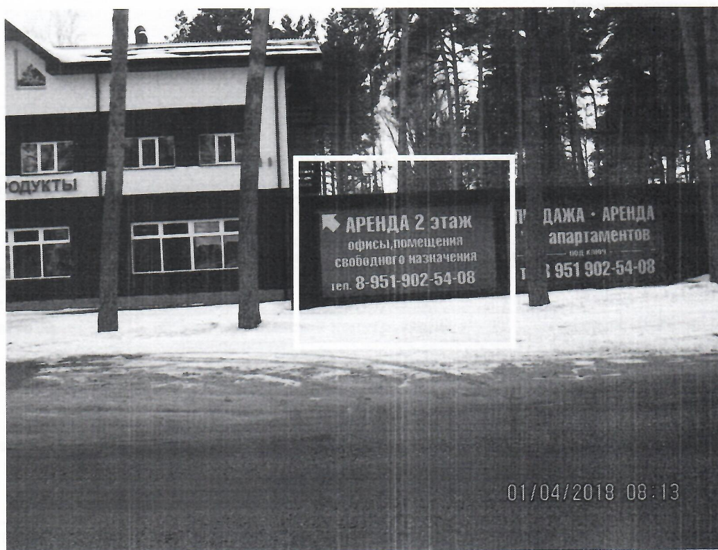
Схема установки рекламной конструкции с эскизным изображением «Аренда 2 этаж» расположенной по адресу: г. Дзержинск, Нижегородская обл., шоссе Желнинское, в районе д.6

Фотофиксация рекламной конструкции с эскизным изображением «Аренда 2 этаж» расположенной по адресу: г. Дзержинск, Нижегородская обл., шоссе Желнинское, в районе д.6