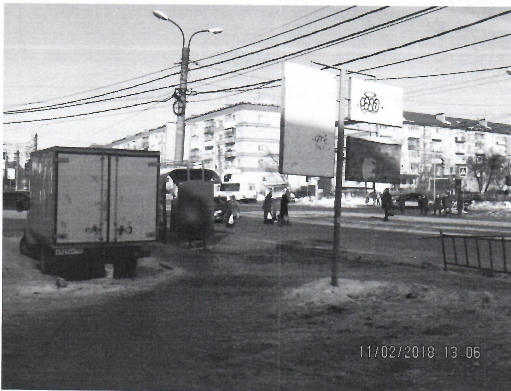
Схема установки рекламной конструкции расположенной по адресу: г. Дзержинск, Нижегородская обл., ул. Гайдара, в районе д.59

Фотофиксация рекламной конструкции расположенной по адресу: г. Дзержинск, Нижегородская обл., ул. Гайдара, в районе д.59