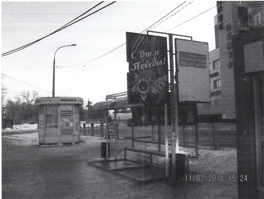
Схема установки рекламной конструкции расположенной по адресу: г. Дзержинск, Нижегородская обл., пр-т Ленина , в районе д.68а

Фотофиксация рекламной конструкции расположенной по адресу: г. Дзержинск, Нижегородская обл., пр-т Ленина , в районе д.68а