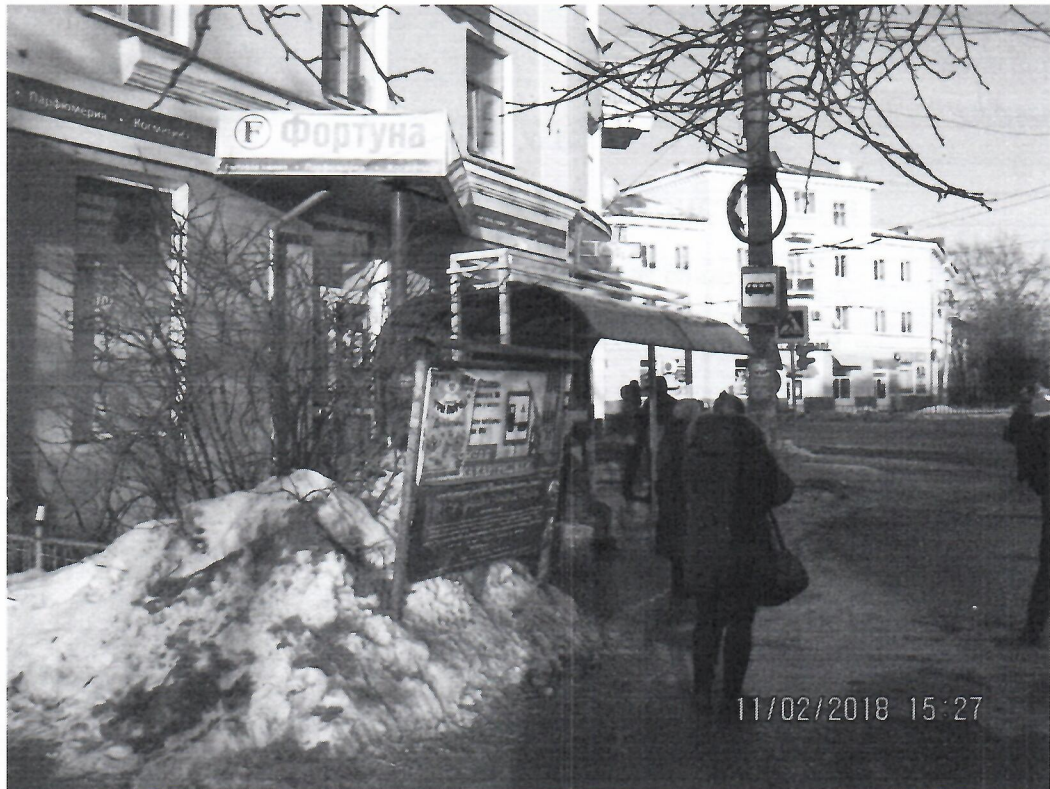
Схема установки рекламной конструкции расположенной по адресу: г. Дзержинск, Нижегородская обл., ул. Октябрьская , в районе д.59

Фотофиксация рекламной конструкции расположенной по адресу: г. Дзержинск, Нижегородская обл., ул. Октябрьская , в районе д.59