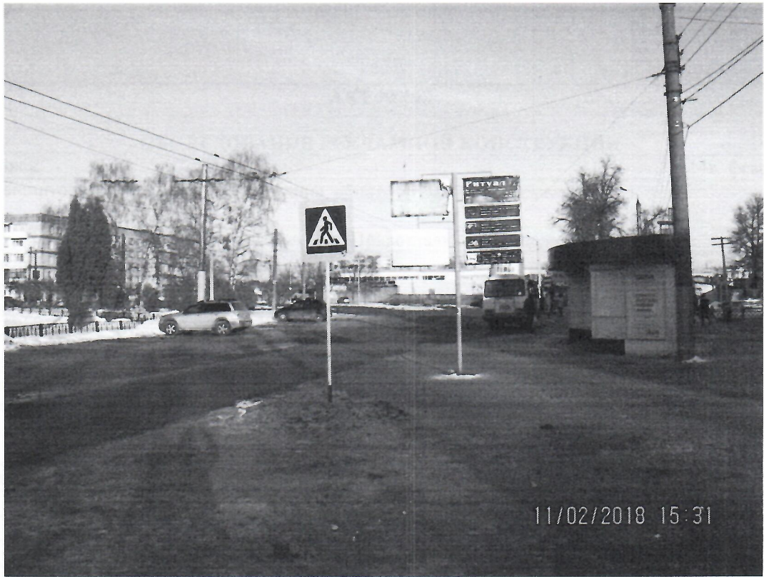
Схема установки рекламной конструкции расположенной по адресу: г. Дзержинск, Нижегородская обл., Привокзальная площадь, в районе д.1

Фотофиксация рекламной конструкции расположенной по адресу: г. Дзержинск, Нижегородская обл., Привокзальная площадь , в районе д.1