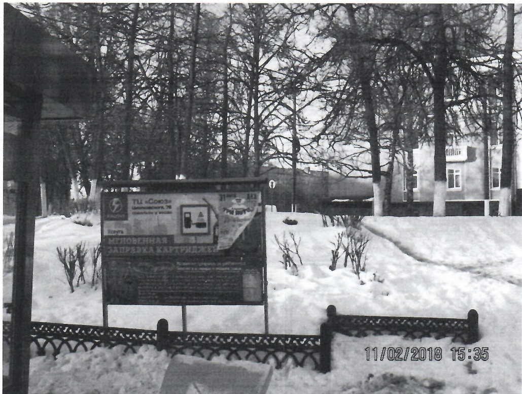
Схема установки рекламной конструкции расположенной по адресу: г. Дзержинск, Нижегородская обл., пр-т Ленина, в районе д.62

Фотофиксация рекламной конструкции расположенной по адресу: г. Дзержинск, Нижегородская обл., пр-т Ленина, в районе д.62