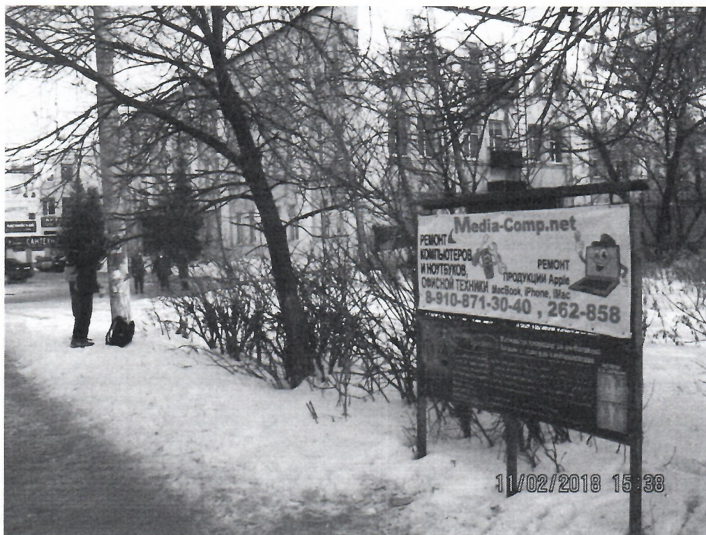
Схема установки рекламной конструкции расположенной по адресу: г. Дзержинск, Нижегородская обл., пр-т Циолковского, в районе д.17

Фотофиксация рекламной конструкции расположенной по адресу: г. Дзержинск, Нижегородская обл., пр-т Циолковского, в районе д.17