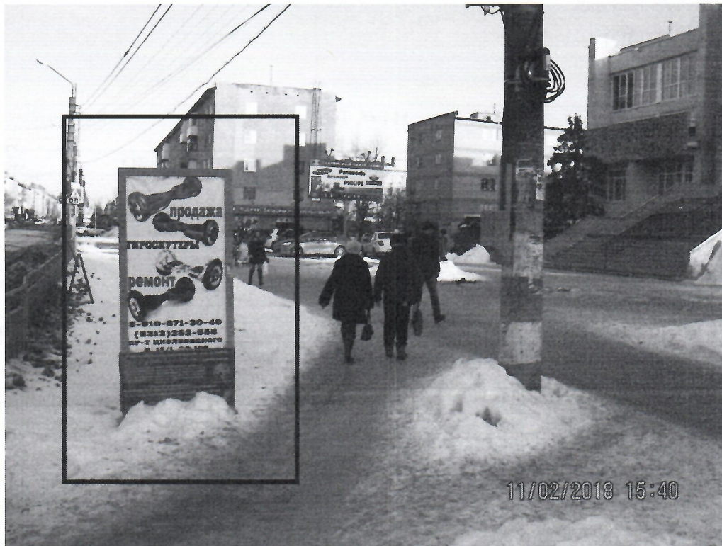
Схема установки рекламной конструкции расположенной по адресу: г. Дзержинск, Нижегородская обл., пр-т Циолковского, в районе д.21г

Фотофиксация рекламной конструкции расположенной по адресу: г. Дзержинск, Нижегородская обл., пр-т Циолковского, в районе д.21г