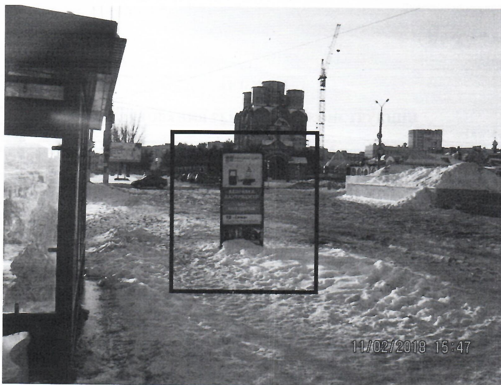
Схема установки рекламной конструкции расположенной по адресу: г. Дзержинск, Нижегородская обл., пр-т Циолковского, в районе д.54

Фотофиксация рекламной конструкции расположенной по адресу: г. Дзержинск, Нижегородская обл., пр-т Циолковского, в районе д.54