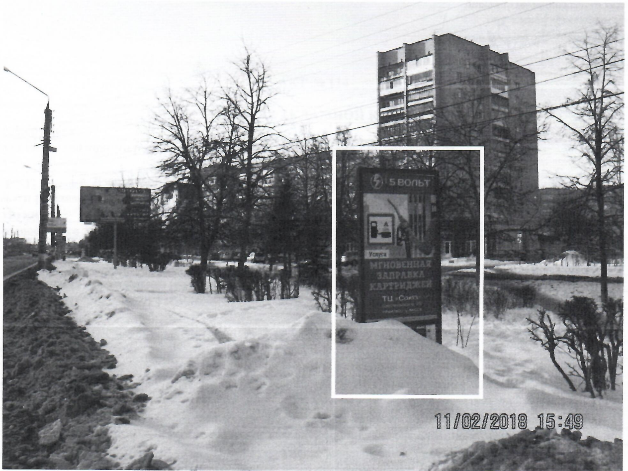
Схема установки рекламной конструкции расположенной по адресу: г. Дзержинск, Нижегородская обл., пр-т Циолковского, в районе д.70

Фотофиксация рекламной конструкции расположенной по адресу: г. Дзержинск, Нижегородская обл., пр-т Циолковского, в районе д.70