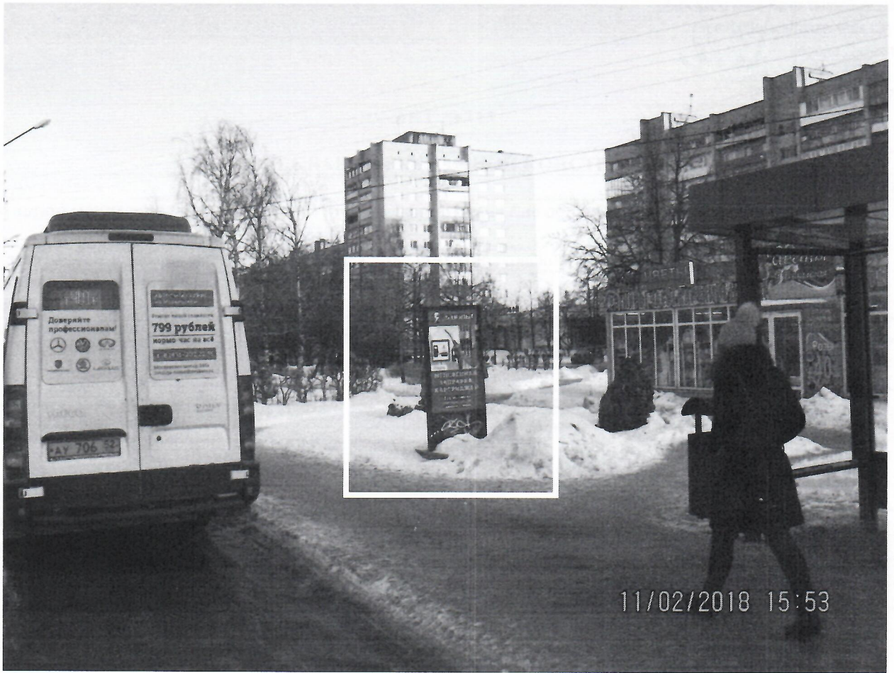
Схема установки рекламной конструкции расположенной по адресу: г. Дзержинск, Нижегородская обл., пр-т Циолковского, в районе д.83

Фотофиксация рекламной конструкции расположенной по адресу: г. Дзержинск, Нижегородская обл., пр-т Циолковского, в районе д.83