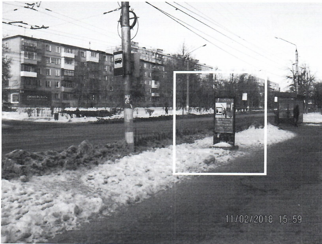
Схема установки рекламной конструкции расположенной по адресу: г. Дзержинск, Нижегородская обл., пр-т Циолковского, в районе д.47

Фотофиксация рекламной конструкции расположенной по адресу: г. Дзержинск, Нижегородская обл., пр-т Циолковского, в районе д.47