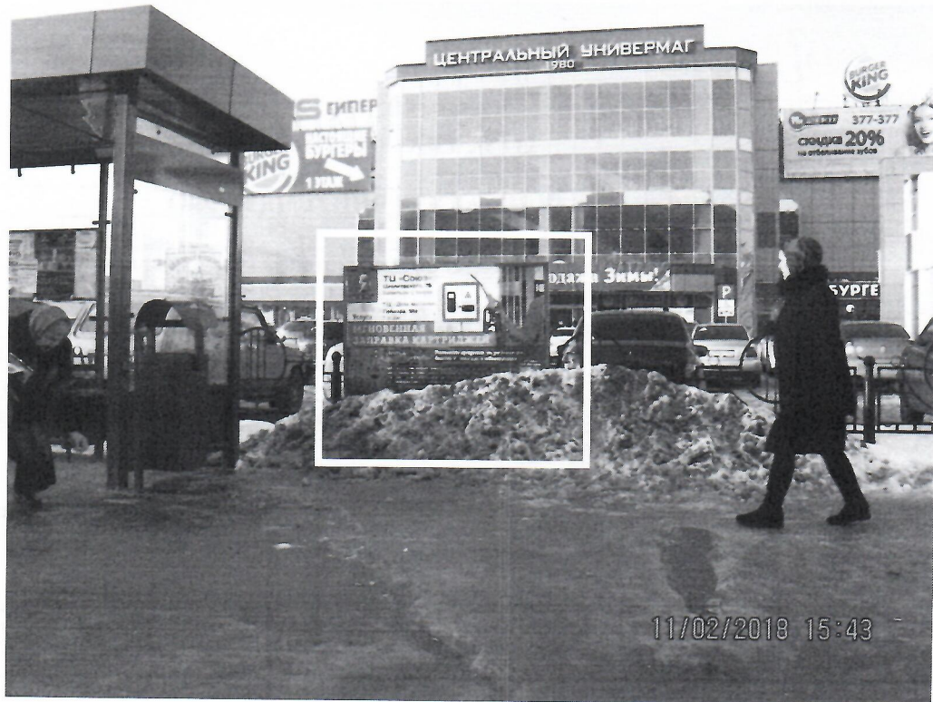
Схема установки рекламной конструкции расположенной по адресу: г. Дзержинск, Нижегородская обл., ул.Гайдара, в районе д.61

Фотофиксация рекламной конструкции расположенной по адресу: г. Дзержинск, Нижегородская обл., ул.Гайдара, в районе д.61