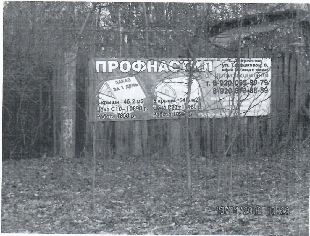
Схема установки рекламной конструкции с эскизным изображением «Профнастил» расположенной по адресу: г. Дзержинск, Нижегородская обл., пос. Дачный, ул.М.Горького, д.81

Фотофиксация рекламной конструкции с эскизным изображением «Профнастил» расположенной по адресу: г. Дзержинск, Нижегородская обл., пос. Дачный, ул.М.Горького, д.81