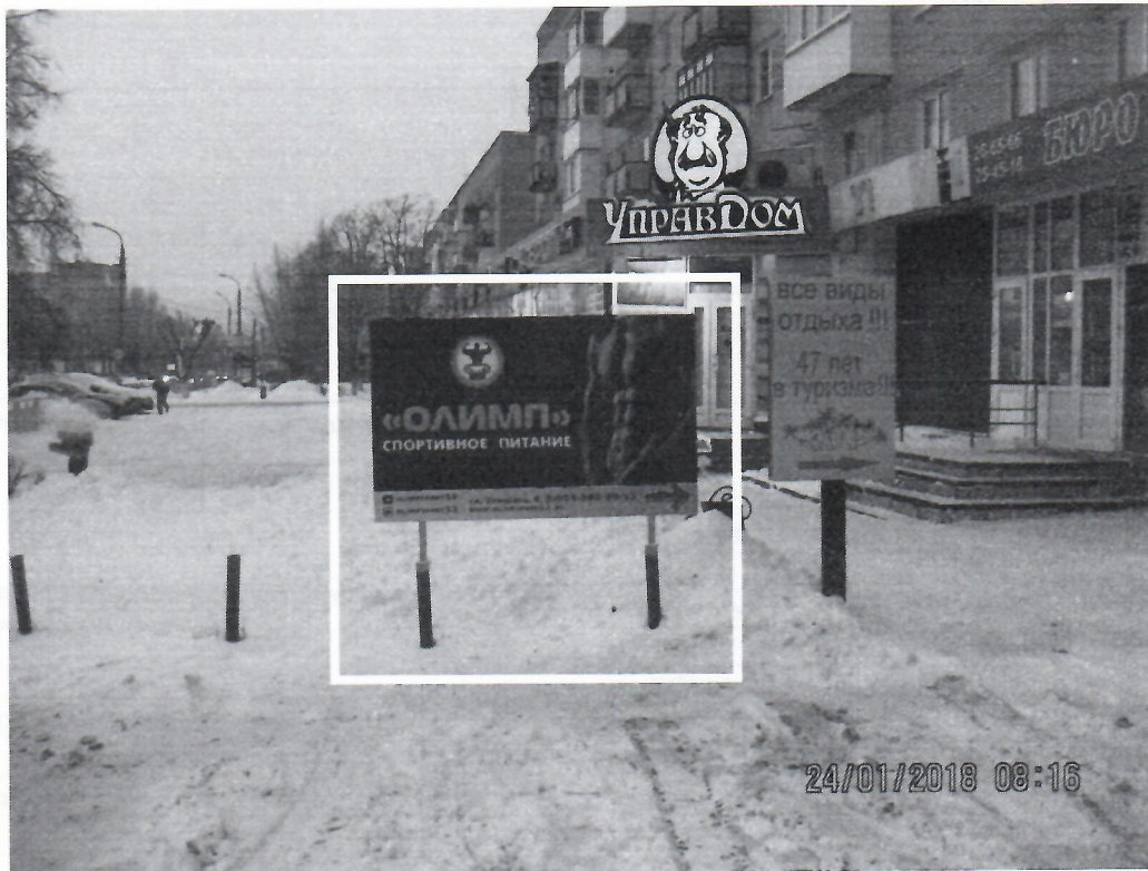
Схема установки рекламной конструкции с эскизным изображением «Олимп» расположенной по адресу: г. Дзержинск, Нижегородская обл., ул. Урицкого, в районе д.4

Фотофиксация рекламной конструкции с эскизным изображением «Олимп» расположенной по адресу: г. Дзержинск, Нижегородская обл., ул. Урицкого, в районе д.4