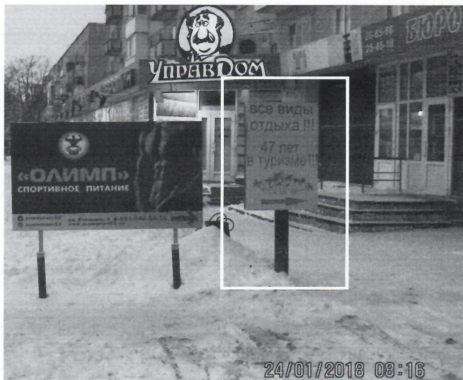
Схема установки рекламной конструкции с эскизным изображением «Все виды отдыха» расположенной по адресу: г. Дзержинск, Нижегородская обл., ул. Урицкого, в районе д.4

Фотофиксация рекламной конструкции с эскизным изображением «Все виды отдыха» расположенной по адресу: г. Дзержинск, Нижегородская обл., ул. Урицкого, в районе д.4