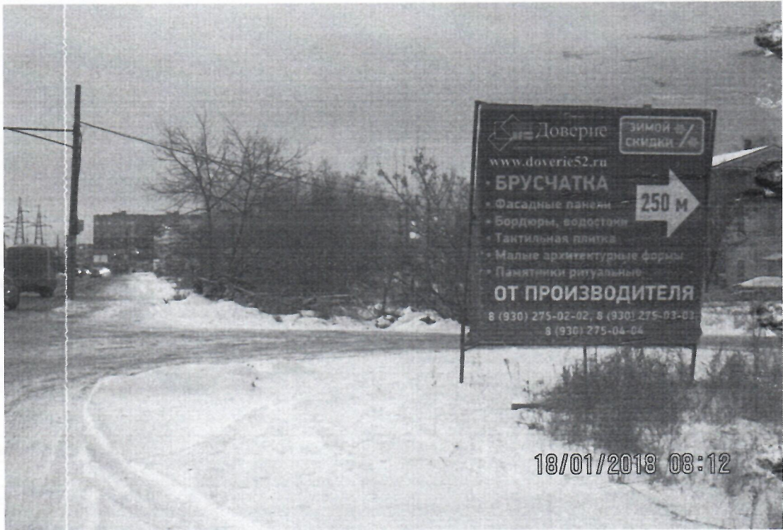
Схема установки рекламной конструкции расположенной по адресу: г. Дзержинск, Нижегородская обл., ул. Красноармейская, в районе д.23

Фотофиксация рекламной конструкции расположенной по адресу: г. Дзержинск, Нижегородская обл., ул. Красноармейская, в районе д.23